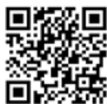
Campagna internazionale Facciate "Wow"

Sistemi di isolamento termico, pitture ed intonaci, elementi architettonici, rivestimenti decorativi, sistemi di risanamento.