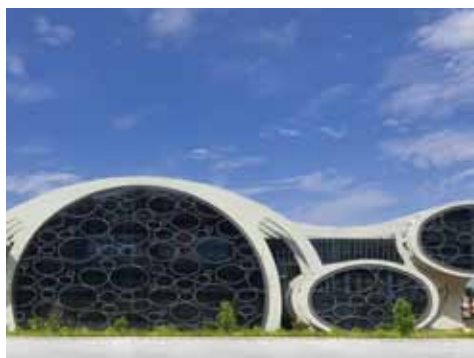
Risanamento del calcestruzzo Maritime Silk Route Museum Guangdong (China)

Sistemi per la protezione e il risanamento di costruzioni in calcestruzzo.