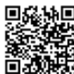
StoTherm In Aevero

Mani di fondo, mani di ancoraggio, stucchi, intonaci, pitture, rivestimenti decorativi, sistemi di isolamento.