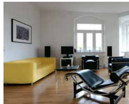
Sistema di isolamento per interni StoTherm In Aevero Premio Klimahouse Trend 2012