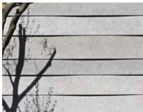
Modulazione 3D delle facciate con isolamento a cappotto Bikini, Berlino (Hild und K Architekten, Monaco)